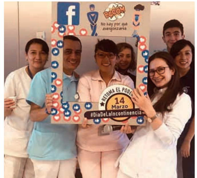
▶ Algunos participantes y exponentes de la jornada.