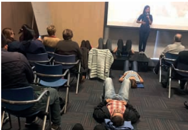
▶ Los participantes durante la sesión teórico-práctica de piso pélvico.